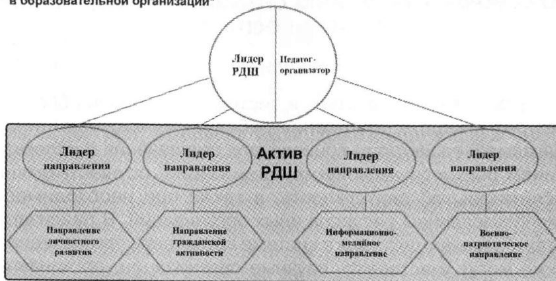
Структура первичного отделения РДШ в образовательной организации*

На муниципальном/районном уровне рекомендуется создавать детские советы по направлениям деятельности, которые объединят лидеров направлений всех школ данного муниципального образования/района. Такую же структуру рекомендуется создать на уровне региона из числа лидеров муниципальных/районных советов, лидеры которых входят в рабочие группы при совете регионального отделения РДШ.